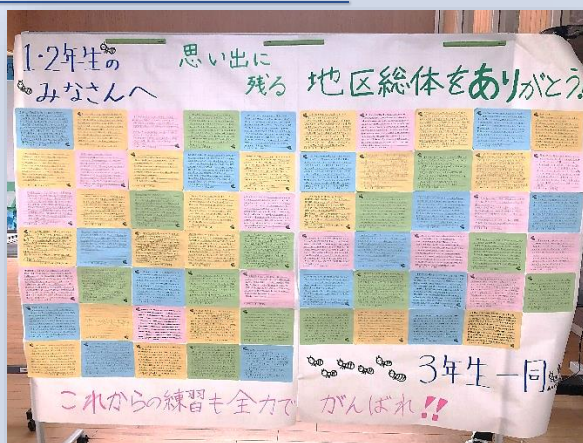
3年生の皆さん、心温まる